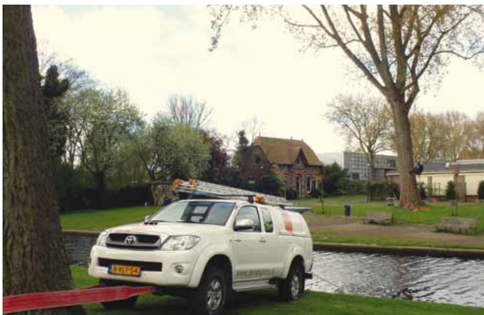
Tabel B: Verhoudingen onderzoeksmethoden en -instrumenten.

gemaakt van dezelfde meetpunten als van de geluidsmeting. Het meetresultaat laat zich in beginsel niet 1-2-3 lezen, omdat er in boomsoorten een onderscheid blijkt van bomen met een relatief droge of natte kern, waarbij eiken een uitzondering vormen. Het referentiebeeld van een boomsoort is dan de basis voor verdere interpretatie. Hierbij moet in ogenschouw worden genomen dat het meetbereik, zowel onder als bomen het meetoppervlak, een verticale spreiding heeft